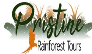
Pristine Rainforest Tours